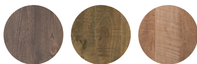
Mokka Mango Old teak