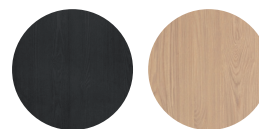
Noir** Blond oak