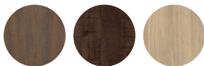
Dark almond Dark mango Fresh oak