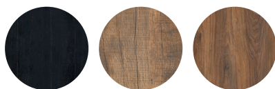
Old piano Orient Sheesham