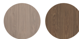
Misty oak Hazel

Onderhoudsadvies: U kunt lamulux vergelijken met de toplaag van een goede laminaat vloer. Het heeft verder geen onderhoud nodig, enkel regelmatig afnemen met een droge katoenen doek en vlekken verwijderen met een licht vochtige katoenen doek volstaat. Wel altijd even nadrogen met een schone katoenen vaatdoek. Hardnekkige vlekken kunnen verwijderd worden met Multi Cleaner welke bij ons verkrijgbaar is.