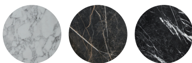
Marble bianco* Marble bromo* Marble nero*