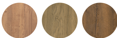
Barley Natur Tobacco